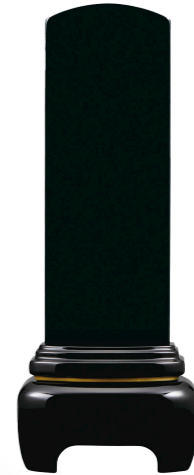
② モダン漆 K