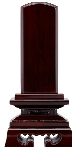
③ 春日楼門 唐木