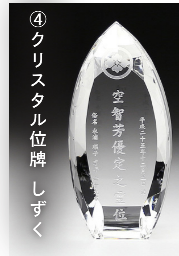
④ クリスタル位牌 しずく